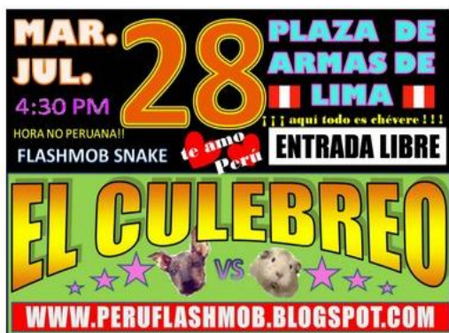
Flashmob Snake o del juego de la culebra 45

En el 2011 aparecen con más frecuencia flashmobs mercantiles como el de una bebida gaseosa organizado en el “Día de San Valentín” en el Parque del Amor en Miraflores, amenizado adicionalmente con música. También se dan otros organizados por organismos públicos supuestamente para educar a la población para los procesos electorales municipales y nacionales que se realizaron en la primera parte de este año. Así lo señala la nota periodística de un diario local: