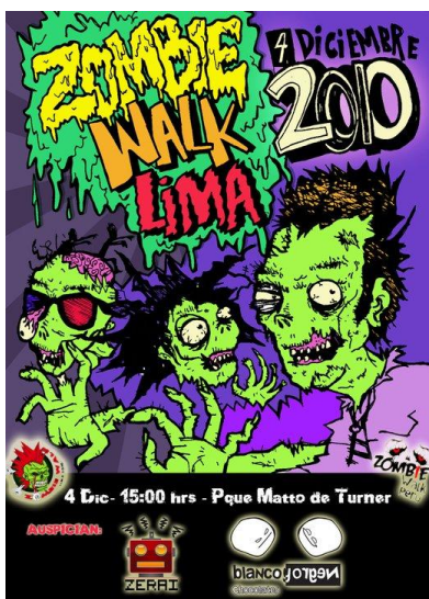
Afiche del primer Zombie Walk en Lima 51

En Lima, este año se realizó el primer Zombie Walk, que fue organizado por un grupo de jóvenes ligados al medio artístico callejero y auspiciado por dos empresas pequeñas. Entre los organizadores hubo por lo menos una persona foránea que había tenido una experiencia previa con un Zombie walk en otra ciudad. La convocatoria e información necesaria para el evento se hizo y se distribuyó básicamente por redes de amigos en facebook, finalmente dicho evento se llevó a cabo en un barrio de clase media al sur de Lima. La consigna era que los participantes se maquillen como zombies o monstruos, para lo cual no faltaron las máscaras y el maquillaje que simulan abundante sangre, heridas y malformaciones.