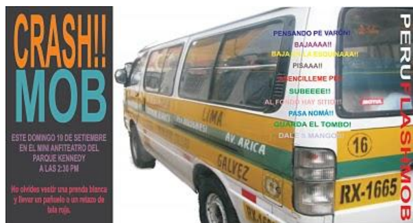
“Crashmob” en Lima 42

No obstante, no podemos obviar otro tipo de iniciativas más reivindicativas, aunque menos exitosas como el Crashmob, cuya idea era concientizar mediante la actividad a los transeúntes, pasajeros y choferes sobre la problemática del transporte público de Lima, evento que fue en seguimiento y coordinación con un movimiento mundial que realizaba el mismo tipo de convocatoria en varias partes del mundo 43 . Además hubo un flashmob denominado “Abre tu paraguas” cuya explicación era la siguiente: